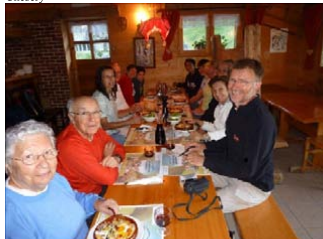
Avec la spécialité en Alpage et les Feux du Lac en conclusion