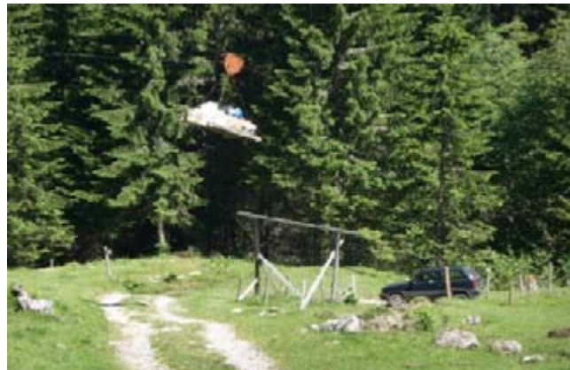
Le ravitaillement du refuge de Trébentaz

Le contournement de Thonon est « en panne » faute de financement et notamment celui de l'état.