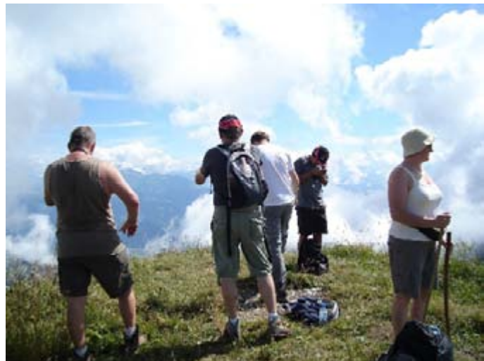
La t te dans les nuages à la Pointe de Recon