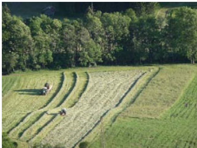
A la Chapelle, ce ne sont pas les vacances pour tous...

Les compressions en horaires de personnels n'ont pas eu d'incidence notable sur la qualité du service.