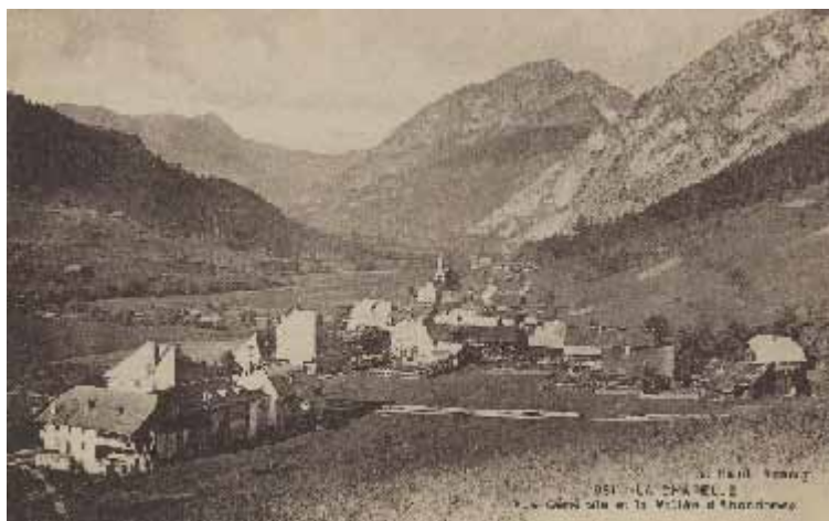
La Chapelle avant le tourisme. Un paysage bucolique. Une vie idyllique ?

Les commerçants ou institutionnels qui souhaitent sponsoriser nos activités en 2013, notamment par des lots, peuvent nous contacter à l'adresse de l'association.