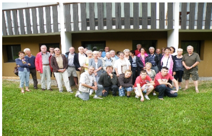
Les 20 ans de l'AAR CA au Bakoua

Depuis 1972 j'en rêvais... Vous êtes sans doute un certain nombre comme moi, alors je vous propose de participer en groupe à l'évènement en nous retrouvant à 17h00 au restaurant du Crêt Béni. Des informations complémentaires seront affichées à l'OT sur le panneau de l'AARCA mais sachez qu'elle sera sans difficulté et accessible à tous (nous ne descendrons pas par la piste rouge).