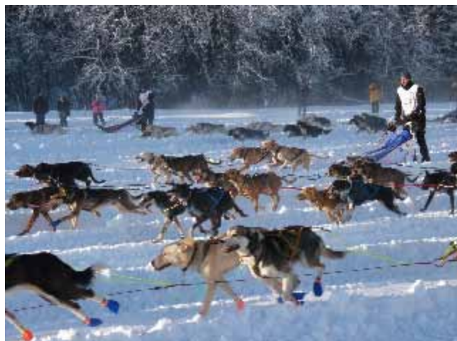
La Grande Odyssée