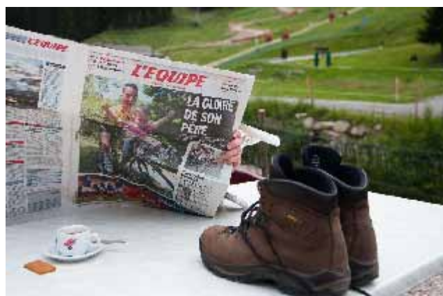
Sportif en pleine action par Patrick Rouvillain (1 er Prix)

(Les illustrations sont extraites des clichés du concours photo 2011 : Les Sports dans la Vallée d'Abondance »