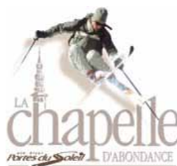
CALD : remontées mécaniques

La grande diversité des participants, de 14 à 78 ans nous a conduits une fois vers les Crosets et l'autre vers Avoriaz où les plus jeunes ont découvert le half- pipe pendant que les plus anciens traînaient un peu à table. Pour eux, le half-pipe, ce sera sans doute pour l'année prochaine.