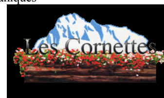
Hôtel Restaurant **