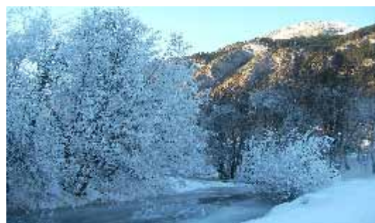
Dranse givrée