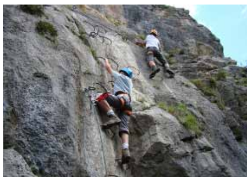
Via Ferrata à Miolène par Arnaud Trésor

Certaines photos ont été déclassées par le jury car prises en dehors de la Vallée d'abondance (rafting à Bioge) L'AARCA remercie les nombreux sponsors qui ont permis d'offrir les récompenses aux photographes et particulièrement les nouveaux « Brinde Fleur » à la Chapelle et la « Poterie de l'Hermitage » à Châtel. Les autres lots offerts en 2011 et à venir seront remis lors de nos autres manifestations (slalom notamment).