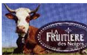
Fromagerie la Chapelle