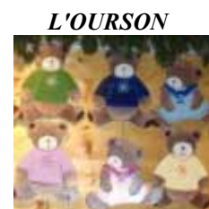
Peinture sur bois