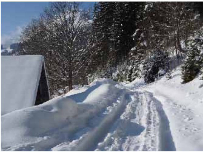
Sous la télécabine de la Panthiaz (Odile Berthoux)