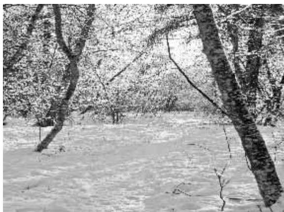
Chemin sous bois (Gabrielle CZYZEWSKI)

L'ordre du jour étant épuisé, l'assemblée générale statutaire est close à 19h30 et le président donne la parole à M le Maire.