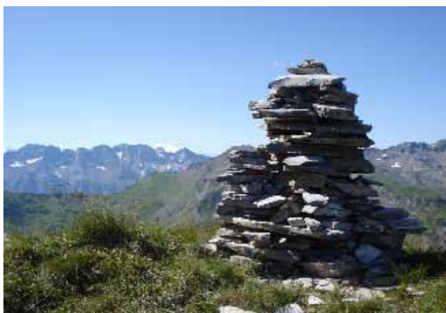
Le cairn de la pointe de Chésery (Arnaud trésor)