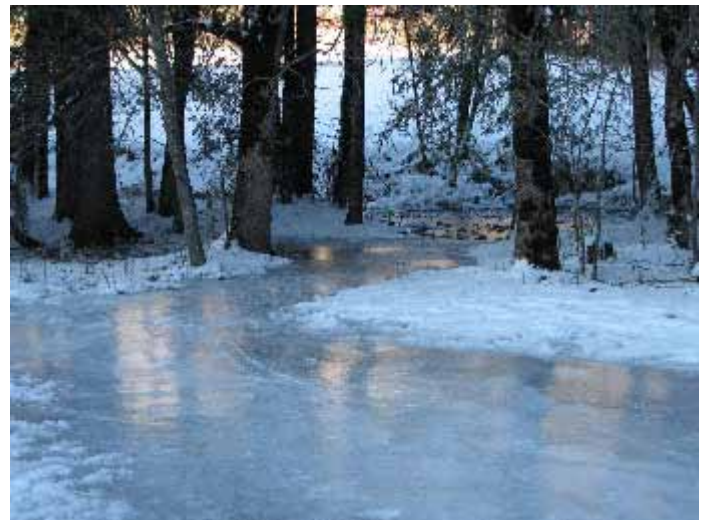
Chemin gelé en bord de Dranse (Charles Schuller)

Nous avons ainsi réclamé pendant 15 ans plus de sécurité pour les piétons, suggéré un aménagement en bord de Dranse et puis un jour... on en a parlé dans les instances dirigeantes, et puis l'idée a avancé, puis a pris forme.