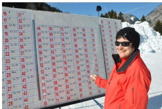
Un exemple d'investissement local pour les adhérents de l'AARCA

Le thème du concours 2013 vous sera révélé en septembre.