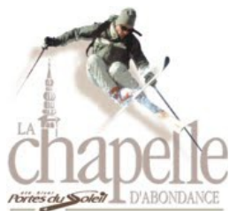
CALD : remontées mécaniques