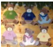
Peinture sur bois