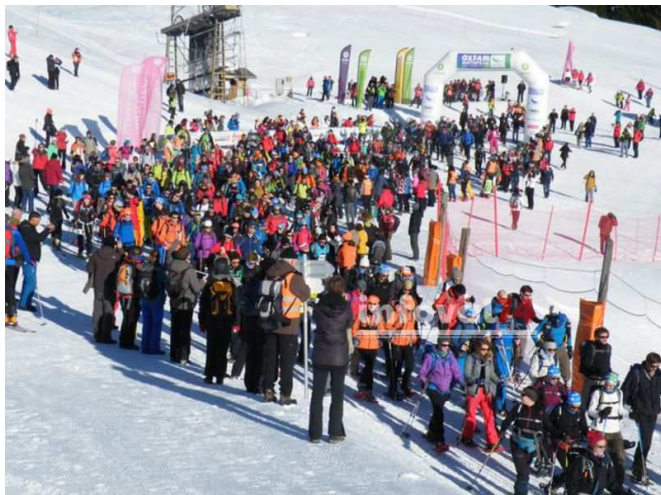
Le départ à l'Essert samedi matin : plus que 60 heures de marche !!!!!

Le deuxième jour, les bénévoles de l'AARCA gardent le sourire