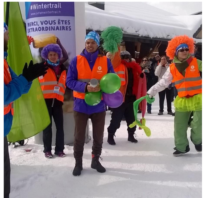
L'arrivée du Wintertrail 2016

Il se déroulera les 4 et 5 mars en Vallée d'Abondance.