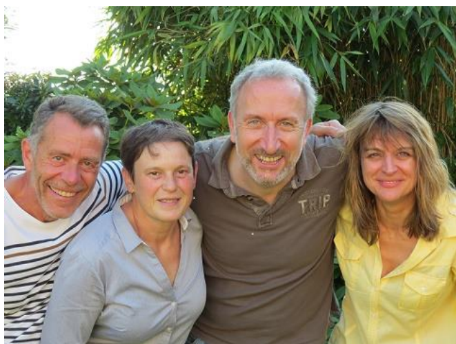
L'équipe : Les Picsous. Les rackets ça nous connaît, (surtout pour la bonne cause)

http://events.oxfamfrance.org/projects/les-picsous-les-rackets-ca-nous-connaît-pour-la-bonne-cause