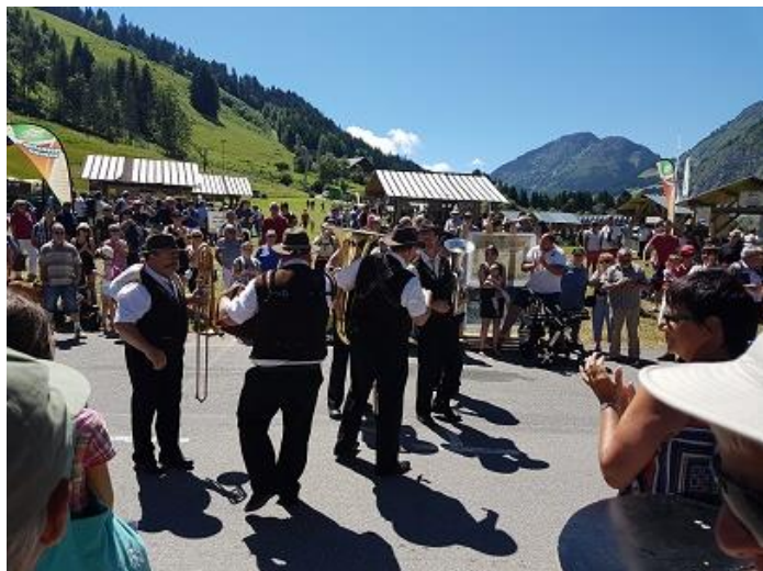
Fête des fromages à la Chapelle le 3 juillet